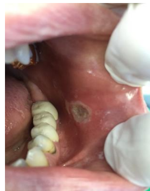
Εικόνα 1. Εξαίρεση αντιδραστικού ινώματος χείλους με laser και στάδια επούλωσης.